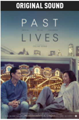
Past Lives di Celine Song (Usa 2023, 106') * v.orig. eng/kor sott. ita