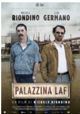
Palazzina Laf di Michele Riondino (Italia 2023, 99')