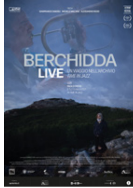
Berchidda Live - Un viaggio nell'archivio di Time in Jazz di Michele Mellara, Alessandro Rossi, Gianfranco Cabiddu (Italia 2023, 94')