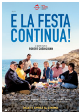
E la festa continua! di Robert Guédiguian (Francia 2023, 106')