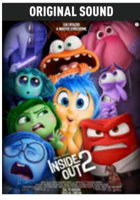
Inside Out 2 di Kelsey Mann (Usa 2024, 96') * v.orig. eng sott. ita