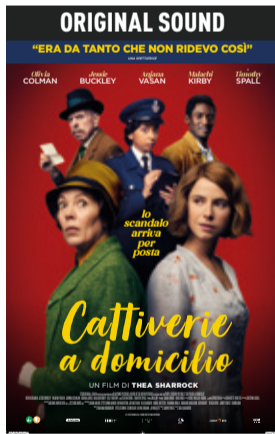
Cattiverie a domicilio di Thea Sharrock (Gb 2023, 100') * v.orig. eng sott. ita