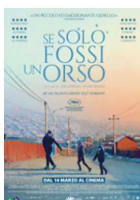
Se solo fossi un orso di Zoljargal Purevdash (Mongolia, Francia 2023, 96')