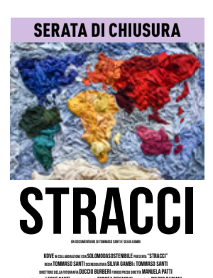
Stracci di Tommaso Santi (Italia 2021, 52') In collaborazione con Rifò, porta un tuo jeans usato ed entri gratis