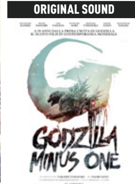
Godzilla minus one di Takashi Yamazaki (Giappone 2023, 125') * v.orig. jap. sott. ita