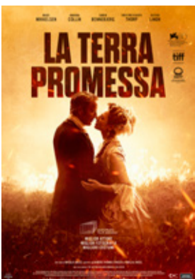
La terra promessa di Nikolaj Arcel (Danimarca 2023, 120')