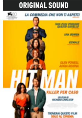
Hit Man - Killer per caso di Richard Linklater (Usa 2023, 113') * v.orig. eng sott. ita