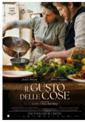
Il gusto delle cose di Tran Anh Hung (Francia 2023, 145')