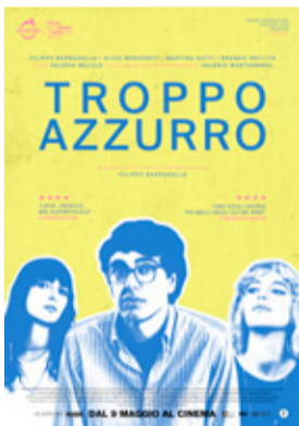
Troppo azzurro di Filippo Barbagallo (Italia 2023, 88')