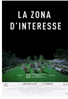
La zona d'interesse di Jonathan Glazer (Gb/ Usa/Polonia 2023, 105')