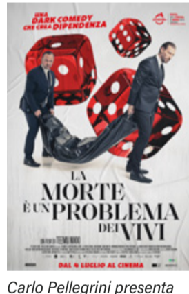
La morte è un problema dei vivi di Teemu Nikki (Finlandia, Italia 2023, 98')