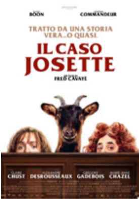
Il caso Josette di Fred Cavayé (Francia, Belgio 2024, 100')