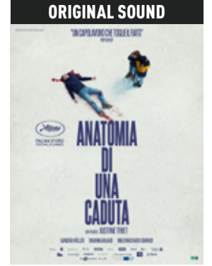
Anatomia di una caduta di Justine Triet (Francia 2023, 150') * v.orig. eng/fra sott. ita