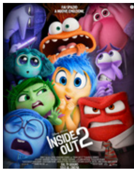
Inside Out 2 di Kelsey Mann (Usa 2024, 96')