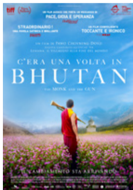
C'era una volta in Bhutan di Pawo Choyning Dorji (Taiwan, Francia, Usa, Bhutan 2023, 107')