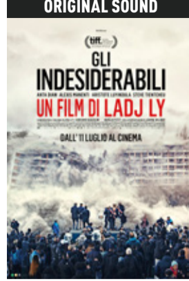
Gli indesiderabili di Ladj Ly (Francia 2023, 101') * v.orig. fra sott. ita