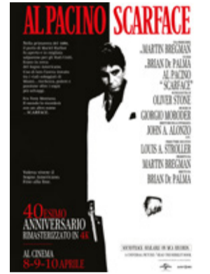
Scarface di Brian De Palma (Usa 1983, 170') * versione restaurata