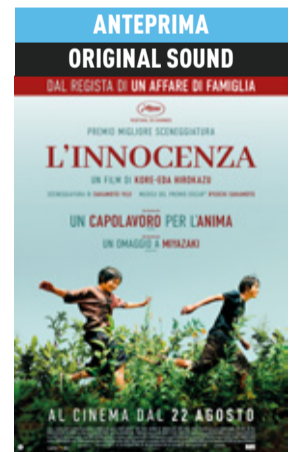
L'innocenza (Monster) di Kore'eda Hirokazu (Giappone 2023, 126') * v.orig. jap. sott. ita