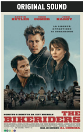
The Bikeriders di Jeff Nichols (Usa 2023, 116') * v.orig. eng sott. ita