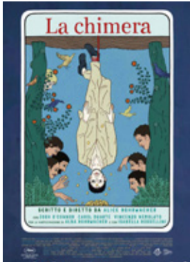
La chimera di Alice Rohrwacher (Italia 2023, 134')